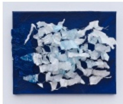
Wasser-Zeichen I—VI Serie, 2011, Acryl, Draht, Pergamentpapier auf Leinwand, je 28x30 cm