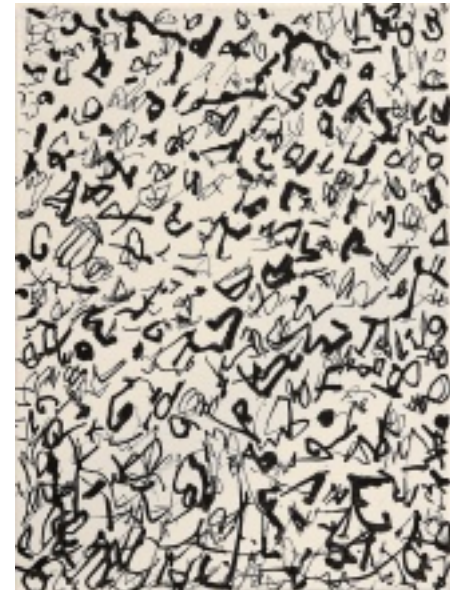
Erzählt I-IV, 2011, Tinte auf Leinwand, je 40x30 cm