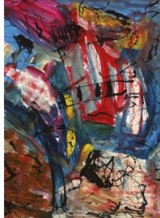
Talwärts I & II, 2011, Acryl/Tinte auf Papier, je 36,9 x 27,8 cm