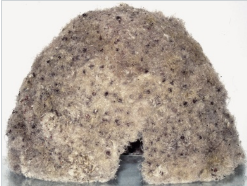
Ohne Titel, 2008, Blüten Samen der Wilden Clematis auf Draht, Objekt, 36 cm x B 50 cm x 50 cm