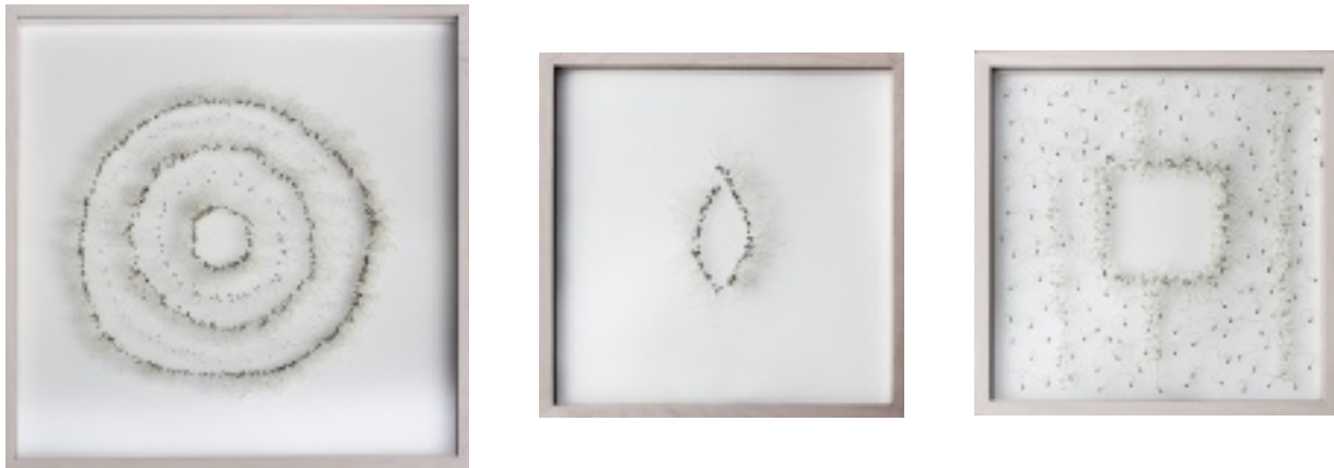
Da Capo V, VI, IV, 2010, Blütensamen der Wilden Clematis auf Glas, dreiteilig: 52x52x2,5 cm, 32x32x2,5 cm, 32x32x2,5 cm