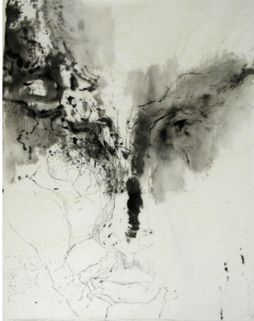
Gesichter sind wie Landschaften, 2010, lasierte Federzeichnung auf Whenzu Papier, 60x40 cm