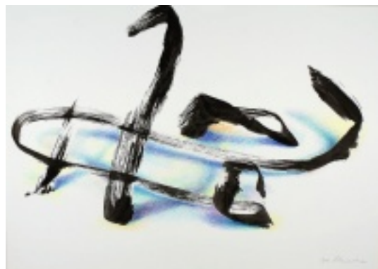
Raum-Zeichen I—III, 2011, Tusche und Farbstift, 30x40 cm