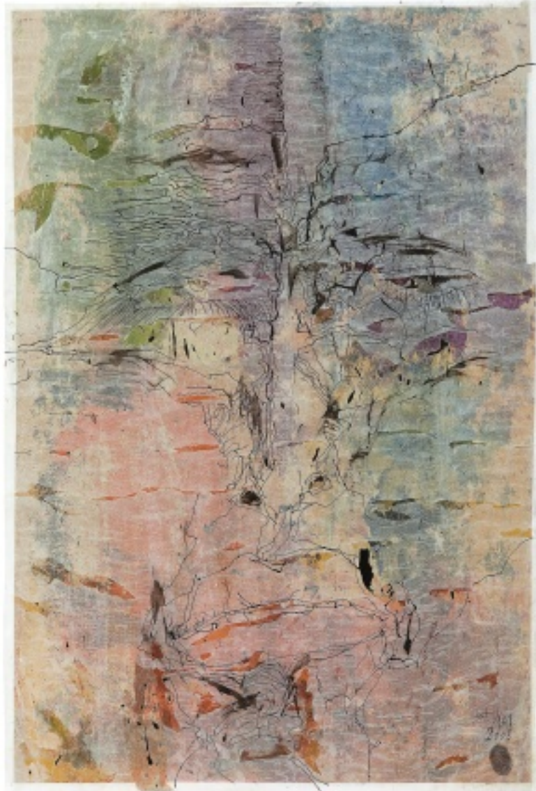
Gesichter sind wie Landschaften, 2010, lasierte Federzeichnung auf Wenzu Papier, 70x50 cm