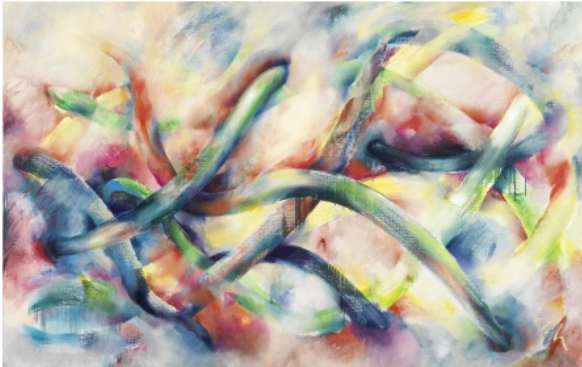
Dancing lines No. 8, 2010, Öl auf Leinwand, 110x190 cm