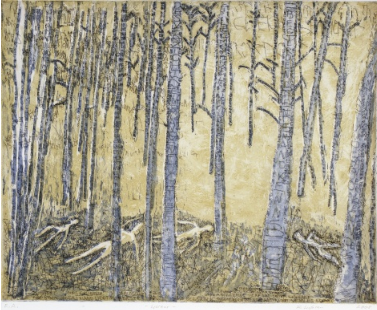
Walzer, 2008, Aquatinta/Ätzradierung, Mehrfarbendruck auf Bütten, H 39,5 cm x B 49,5 cm