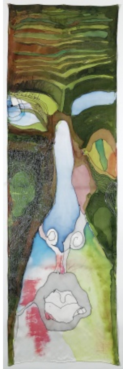
Märkische Elegien, 2006, Seidenmalerei, 160x40 cm