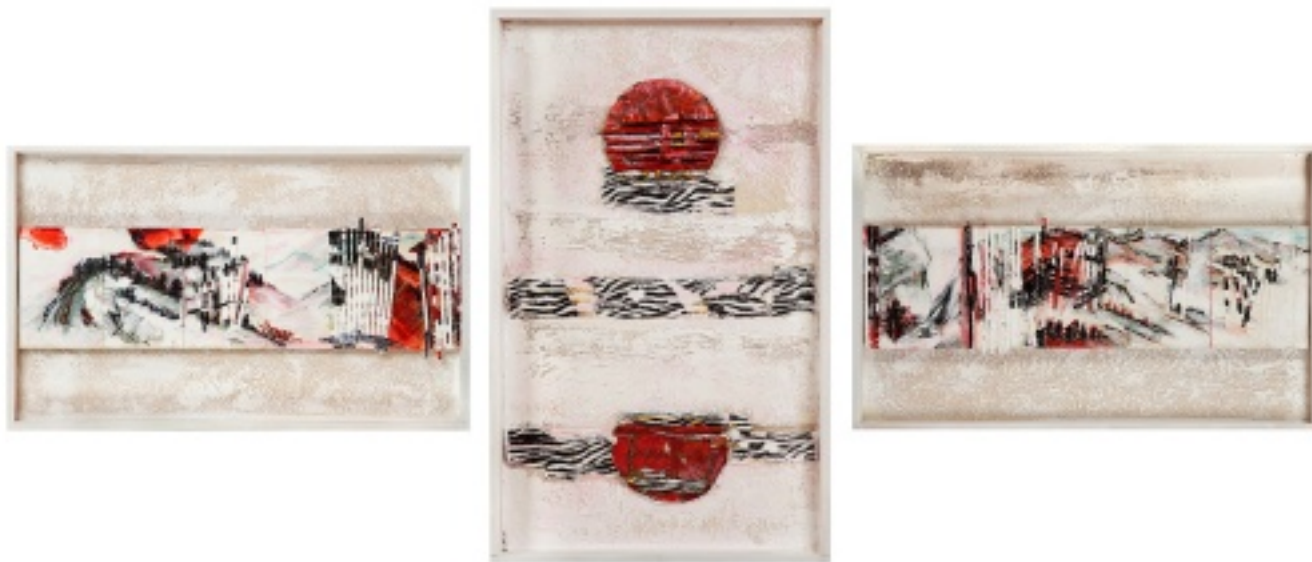
Das Land geteilt—der Himmel vereint, dreiteilig, 2011, Leporello, handgeschöpftes Papier, Collage in Holzkästen, je 30x50 cm