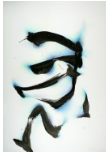
Raum-Zeichen IV—VI, 2011, Tusche und Farbstift, 50x40 cm