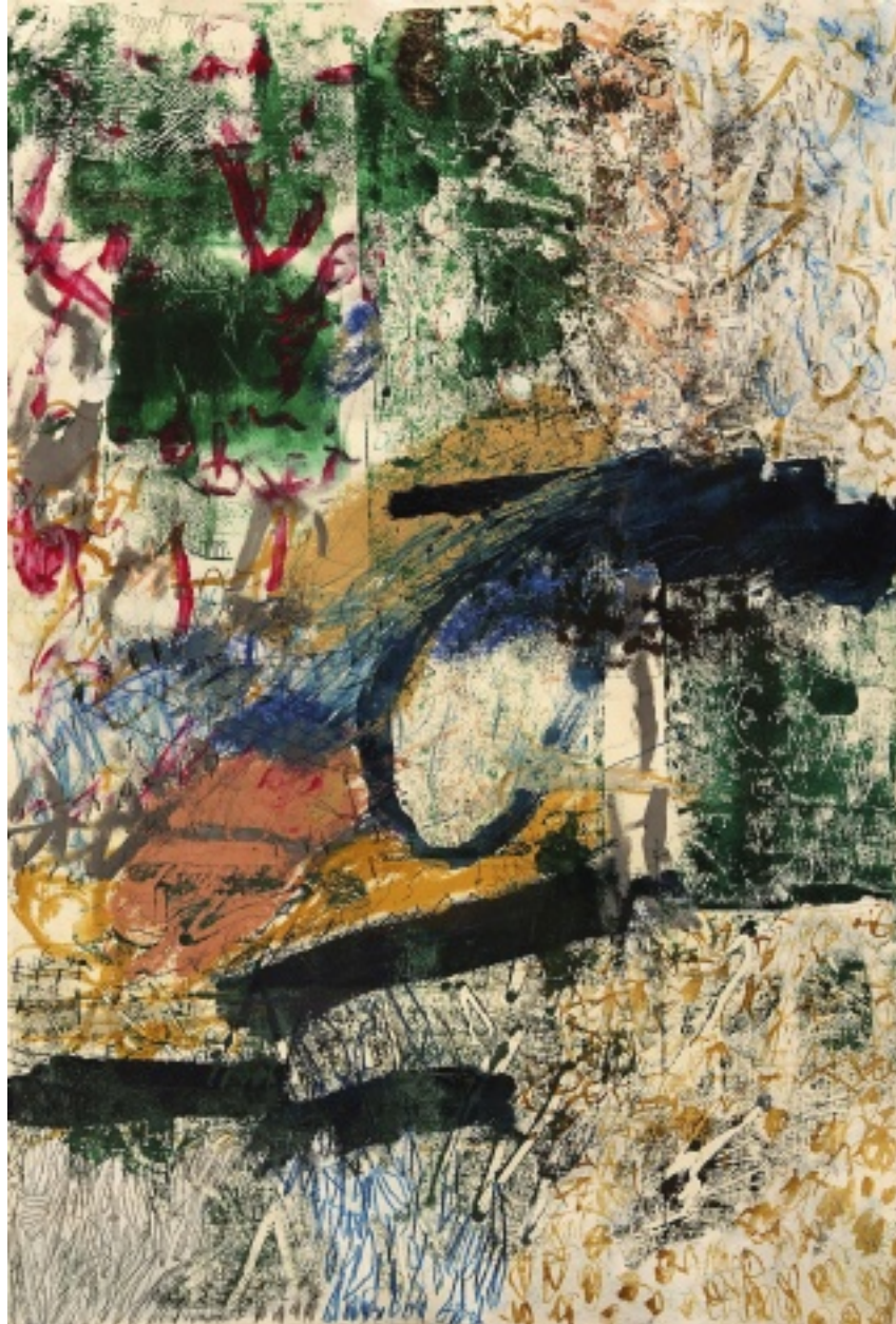
Chinesische Landschaft, 2011, Acryl Stifte Monotopy auf Tiefdruckpapier, 77,9 x 53,8 cm