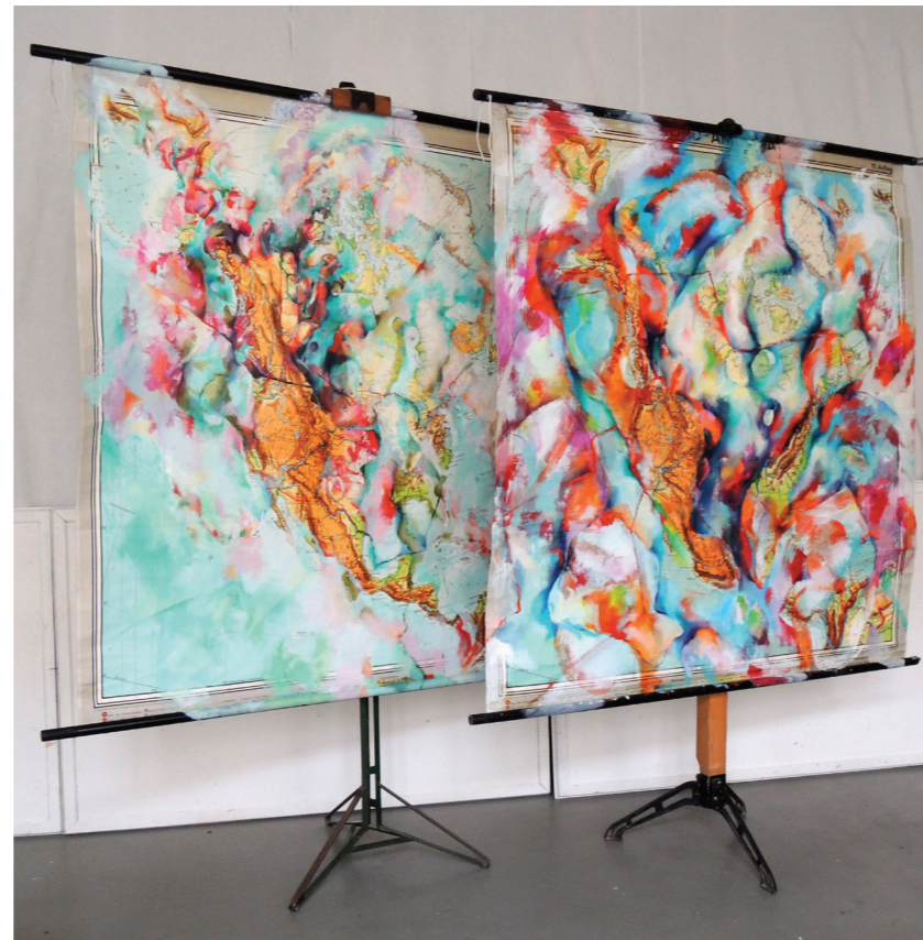
Fiktive Welten no 2 (Nordamerika) , 2013, Mischtechnik/Rollbild, 172 x 155 cm Fiktive Welten no 6 (Nordamerika) , 2014, Mischtechnik/Rollbild, 170 x 150 cm