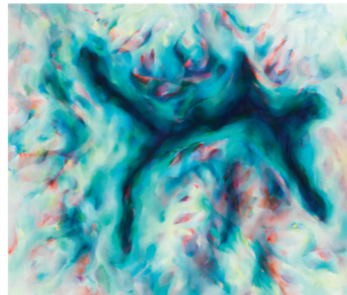
Glazial, 2019, Öl auf Leinwand, 100 x 120 cm

So erfasst sie in ihrer Werkreihe „Fiktive Welten“ mit Hilfe künstlerischer Visualisierungsmittel prekäre geographische, zivilisatorische und industrielle Bedingungen. Menschlichen Eingriffe haben das Gesicht der Erde und die Lebensgrundlagen aller Lebewesen dramatisch verändert.